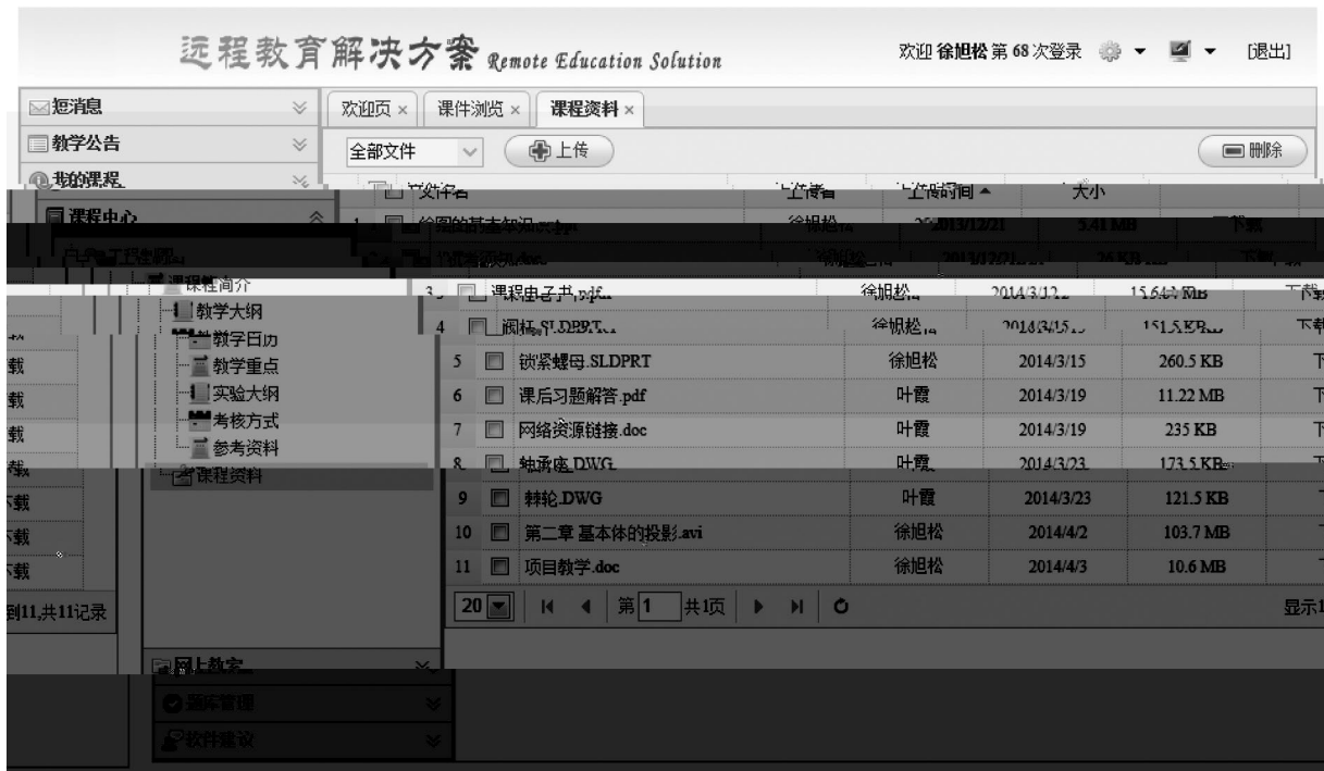
图2 教师用户界面及课程参考资料

用户所上传资料的显示切换,单击某项资料列表最后一列的“下载”即可弹出对应资料的下载提示信息。